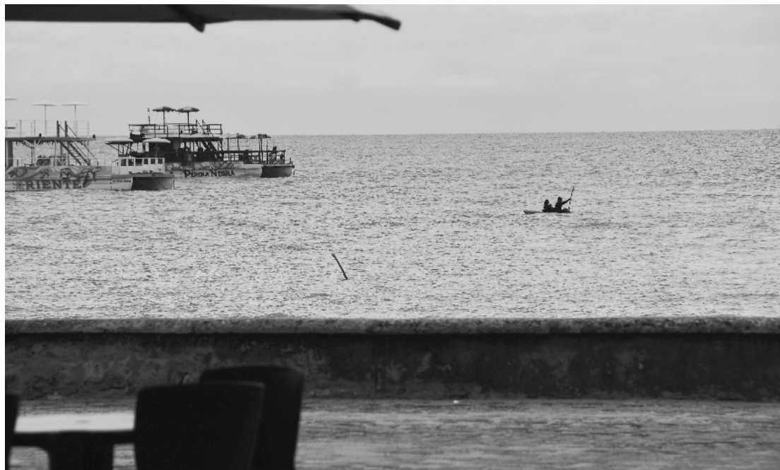
Bons navegantes de águas calmas