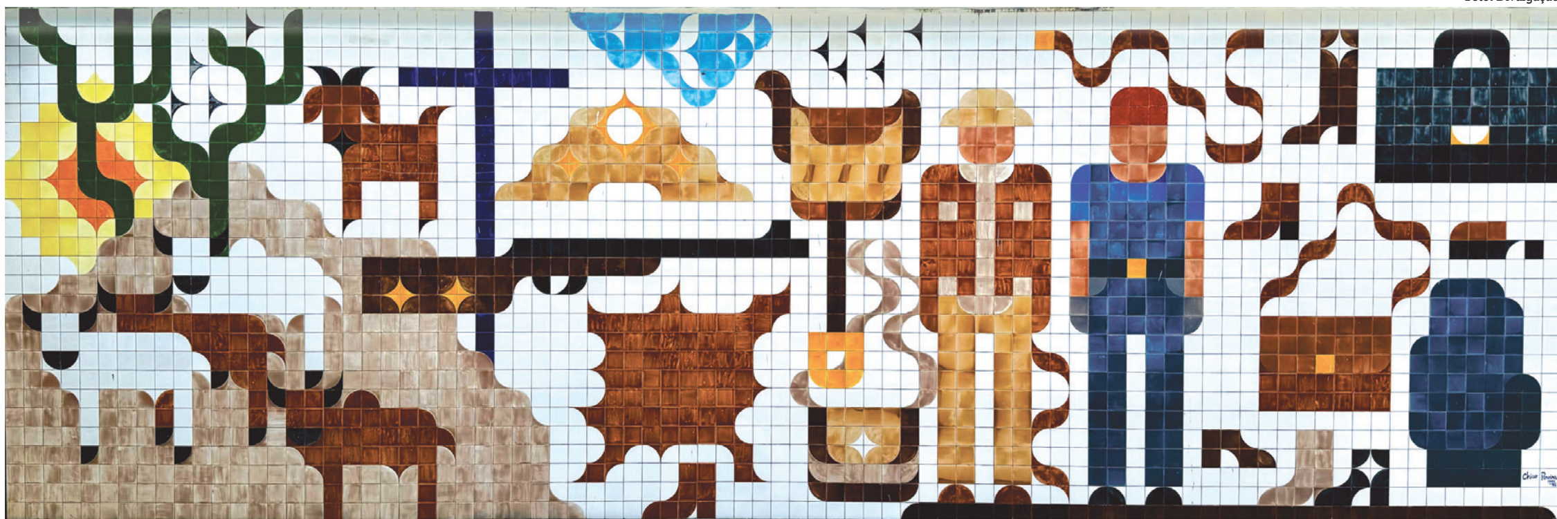
O painel instalado na sede do Serviço Nacional de Aprendizagem Industrial (Senai), em Campina Grande, de 1994, reproduz em azulejos referências que fazem parte do universo do Sertão