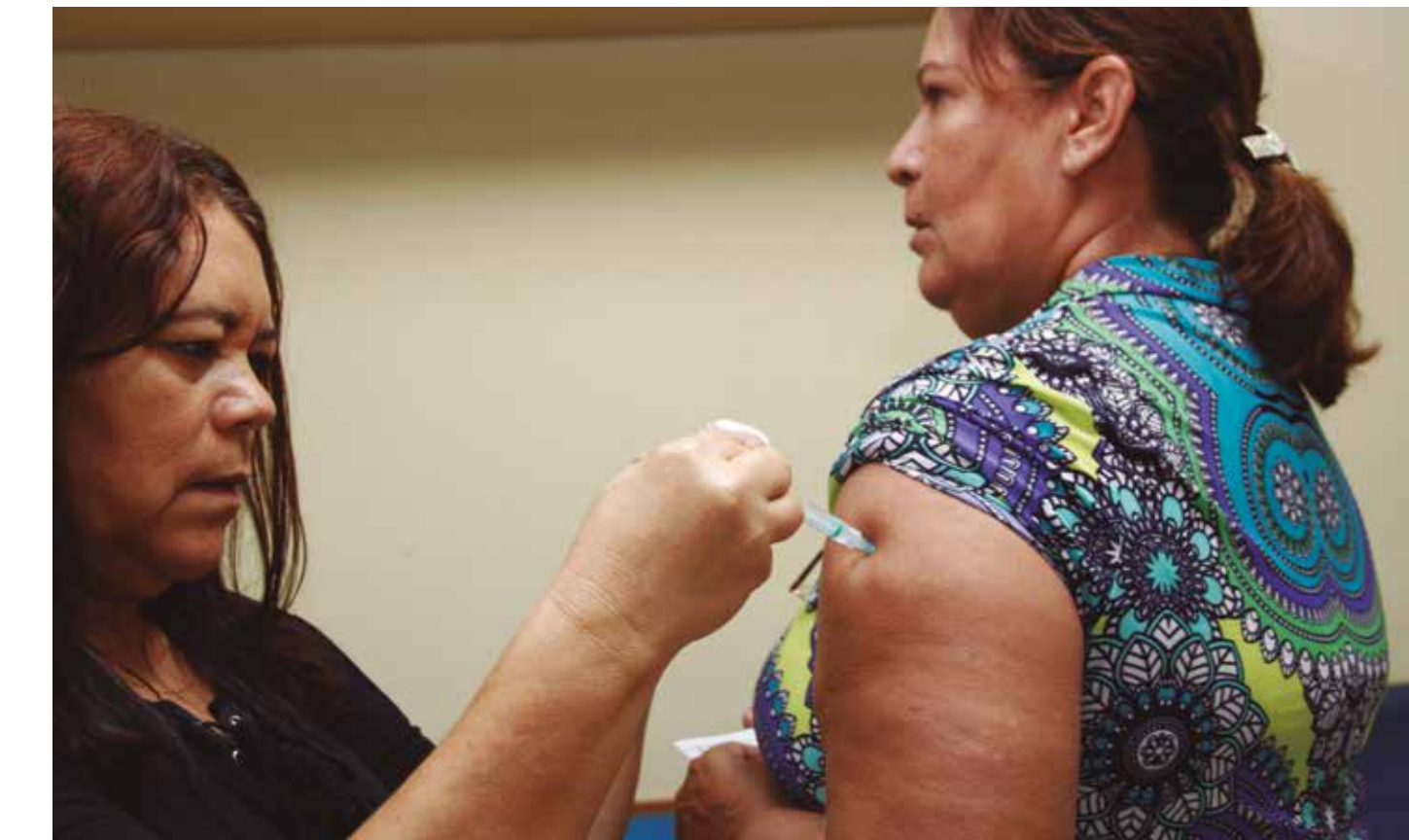
Na Paraíba, a Campanha de Vacinação contra Influenza foi iniciada em 18 de março e segue até o dia 31 deste mês

A Campanha de Vacinação contra Influenza na Paraíba foi iniciada em 18 de março e segue até o dia 31 deste mês. Até o momento,