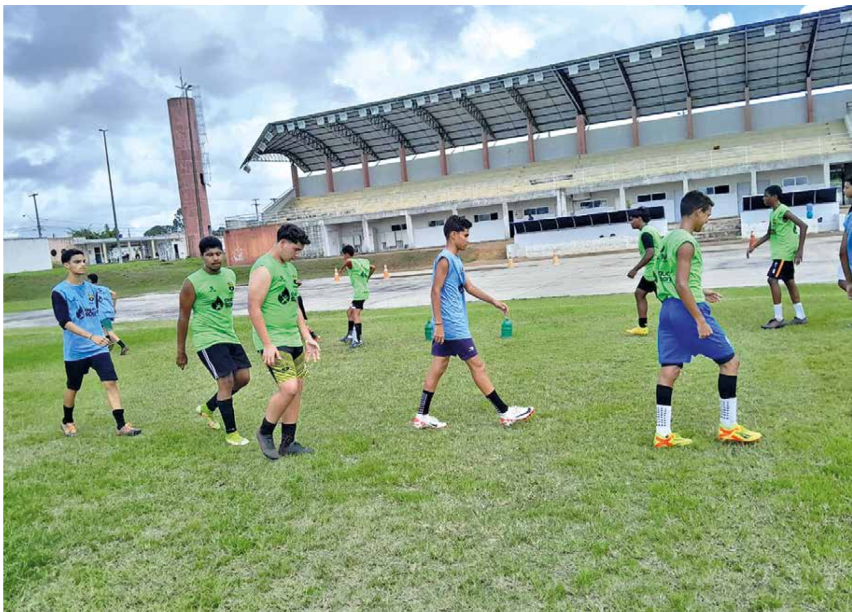
Jogadores do Kashima em atividade na Vila Olímpica Ivan Thomaz, no Valentinia, se preparando para a estreia no Campeonato Paraibano Sub-17

Internacional, Escorpions, Padre Zé, Sport Lagoa Seca e Vera Cruz