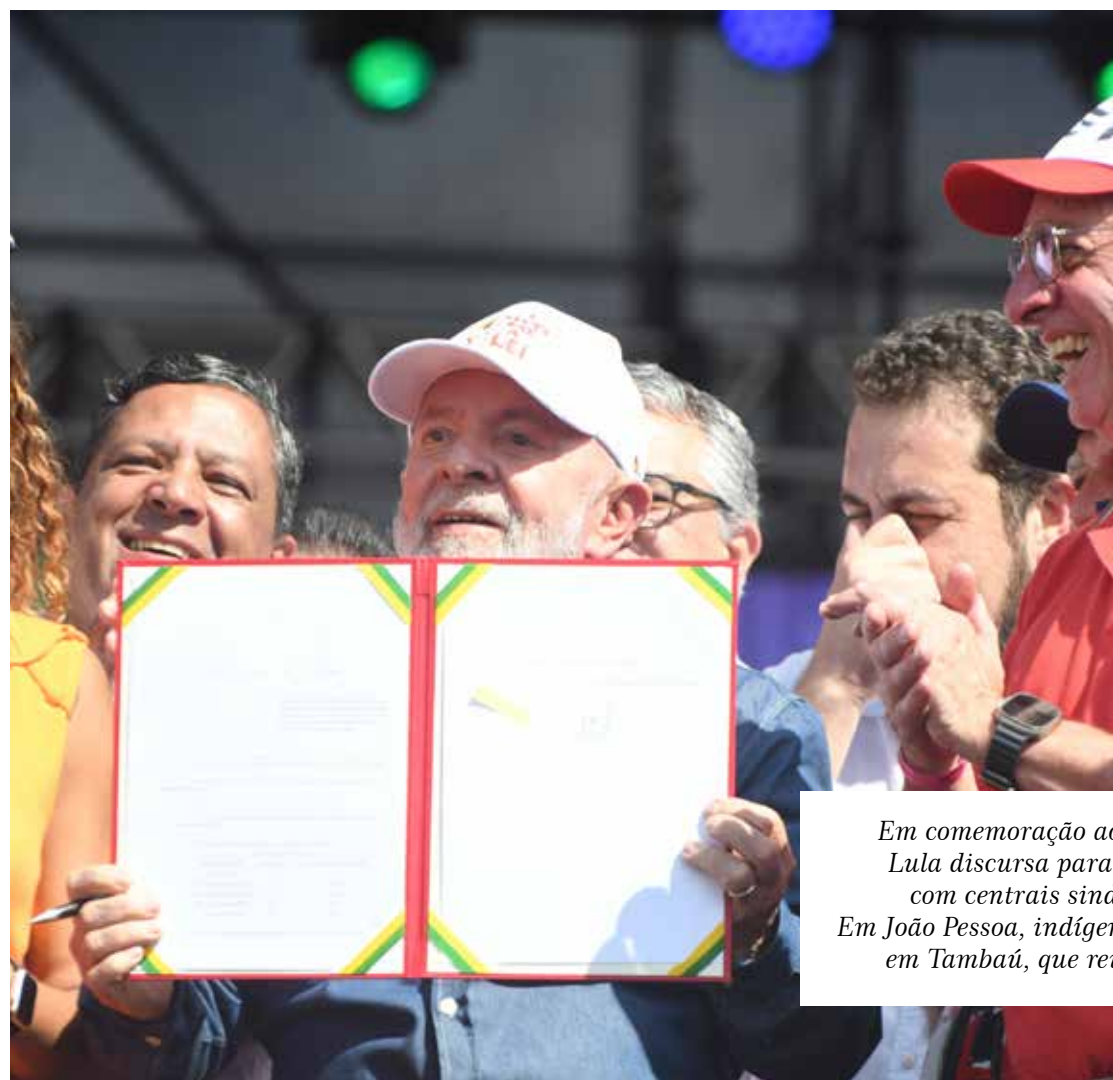
Em comemoração ao 1º de maio, presidente Lula discursa para trabalhadores, em ato com centrais sindicais, em São Paulo. Em João Pessoa, indígenas animam manifestação, em Tambaú, que reuniu alguns sindicatos