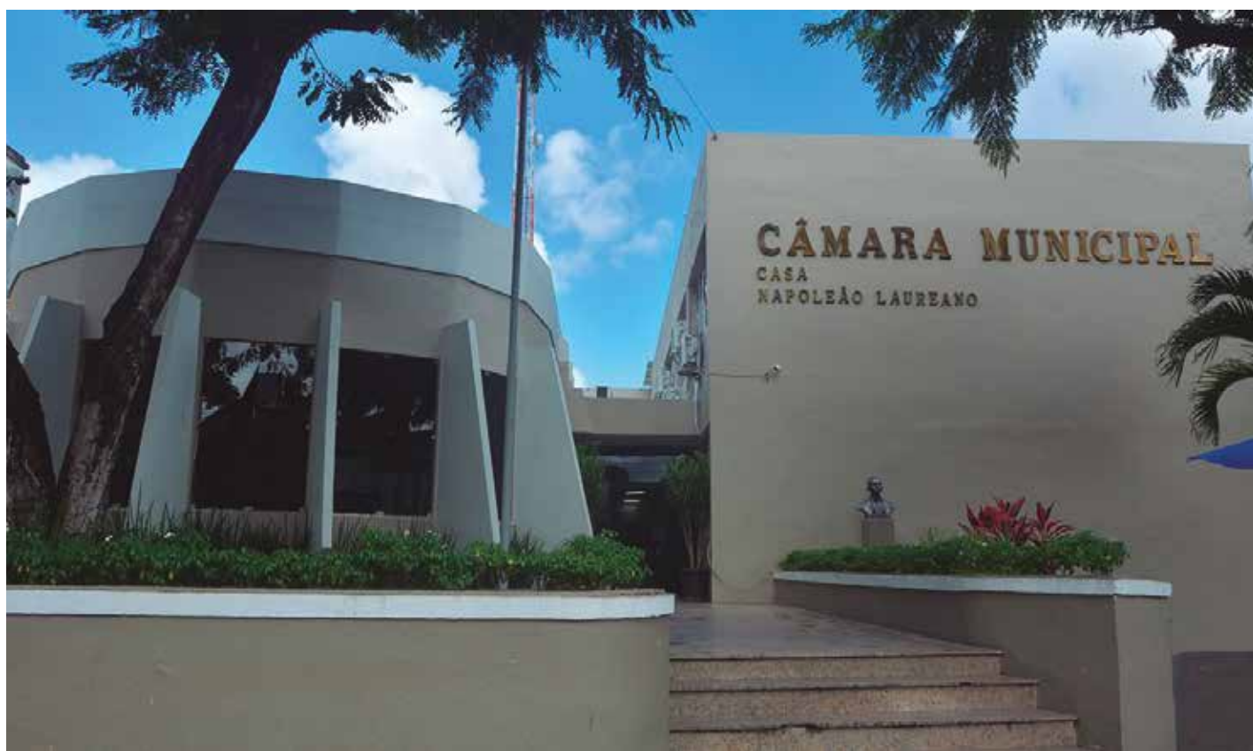
Na Casa Legislativa Napoleão Laureano, parlamentares recebem R$ 20,8 mil; presidente desembolsa mais de R$ 27 mil

No Sertão paraibano, a Câmara Municipal de Patos aprovou o reajuste dos subsídios pagos aos vereadores e ao presidente da Câmara em segundo turno na semana passada. A partir do próximo ano, o valor pago aos vereadores salta de R$ 10 mil para R$ 17 mil. O presidente da Câmara passa a receber R$ 22 mil.