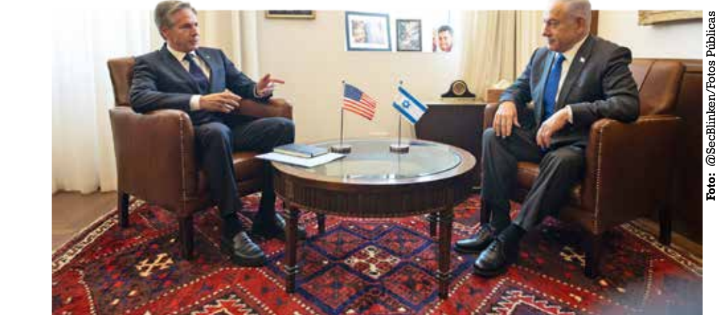
Secretário de Estado dos EUA em reunião com o primeiro-ministro Benjamin Netanyahu

"Estamos determinados a conseguir um cessar-fogo que traga os reféns para casa e fazê-lo agora, e a única razão pela qual isso não seria alcançado é por causa do Hamas", disse Blinken ao presidente cerimonial de Israel, Isaac Herzog, em uma reunião em Tel Aviv. "Há