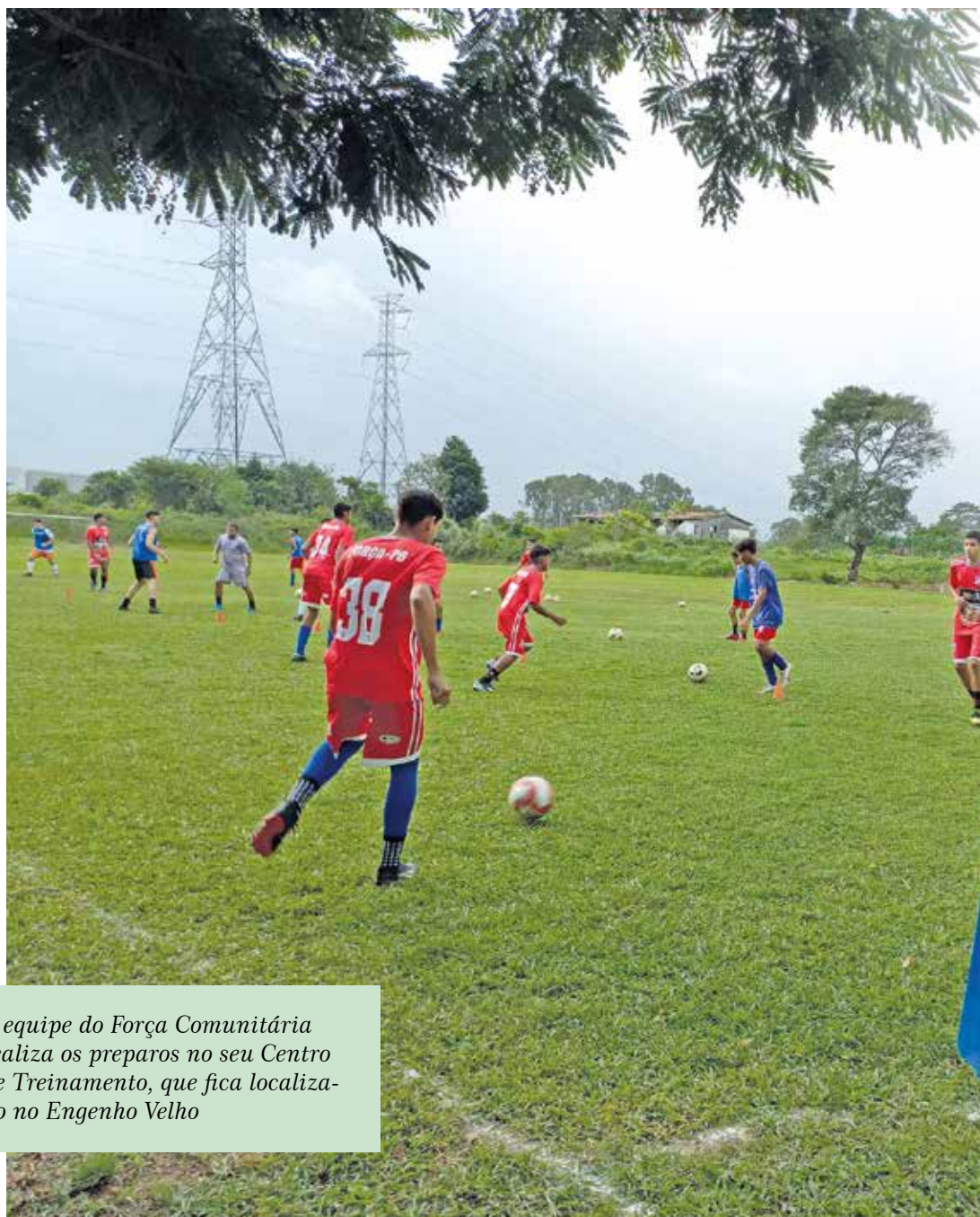
A equipe do Força Comunitária realiza os preparos no seu Centro de Treinamento, que fica localizado no Engenho Velho

Além disso, tem quatro vestiários, academia, sala de fisioterapia, recepção, sala de reuniões, camarote para assistir aos jogos, escritórios, banheiros sociais, lanchonete, estacionamento e espaço de convivência.